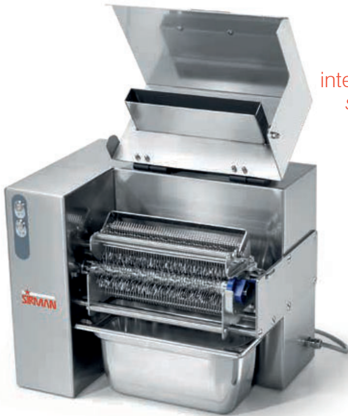
Vaschetta inox opzionale Optional s/steel tray