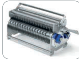
Gruppo lame taglio: da 10 mm con 48 lame da 15 mm con 32 lame Cutting blade assembly: 10 mm with 48 blades 15 mm with 32 blades