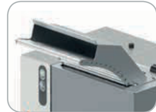
Scivolo su rulli opzionale Optional roller slide