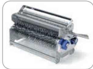
Gruppo lame inteneritrice con 96 lame Tenderizing blade assembly with 96 blades