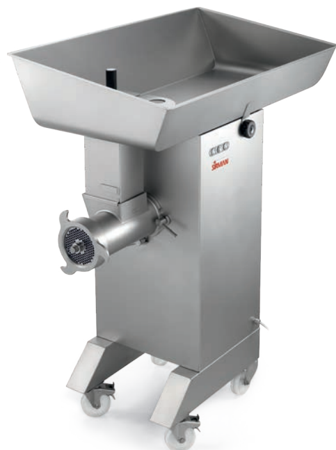
TC 42 MONTANA Y12 - TG