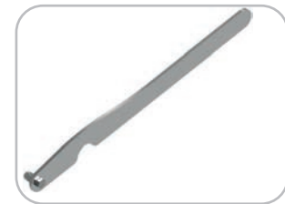
Leva avvita/svita ghiera TC 42 opzionale Optional TC42 ring fixing/removing tool