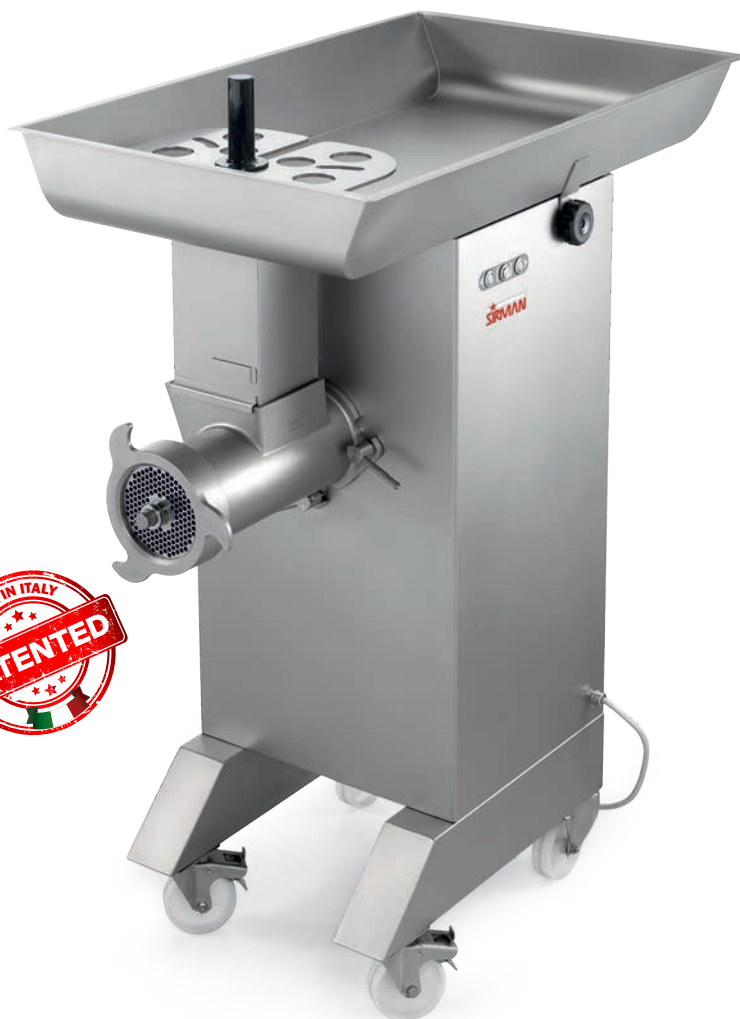
TC 42 MONTANA Y12