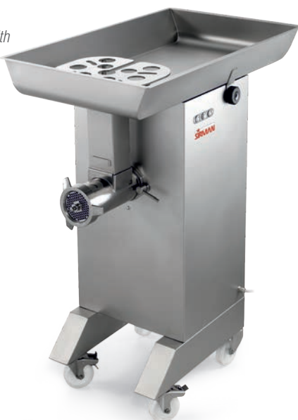
TC 32 MONTANA Y12