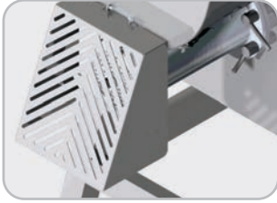
Opzionale: sistema di protezione interbloccato per uso piastre con foro > 8 mm Optional: interlock protection for more than 8 mm holes plates.