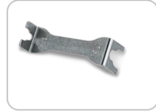
Estrattore piastre Plates removal tool