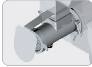
Opzionale: paraspruzzi Optional: splash guard