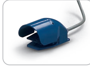
Pedaliera opzionale Optional pedal controls