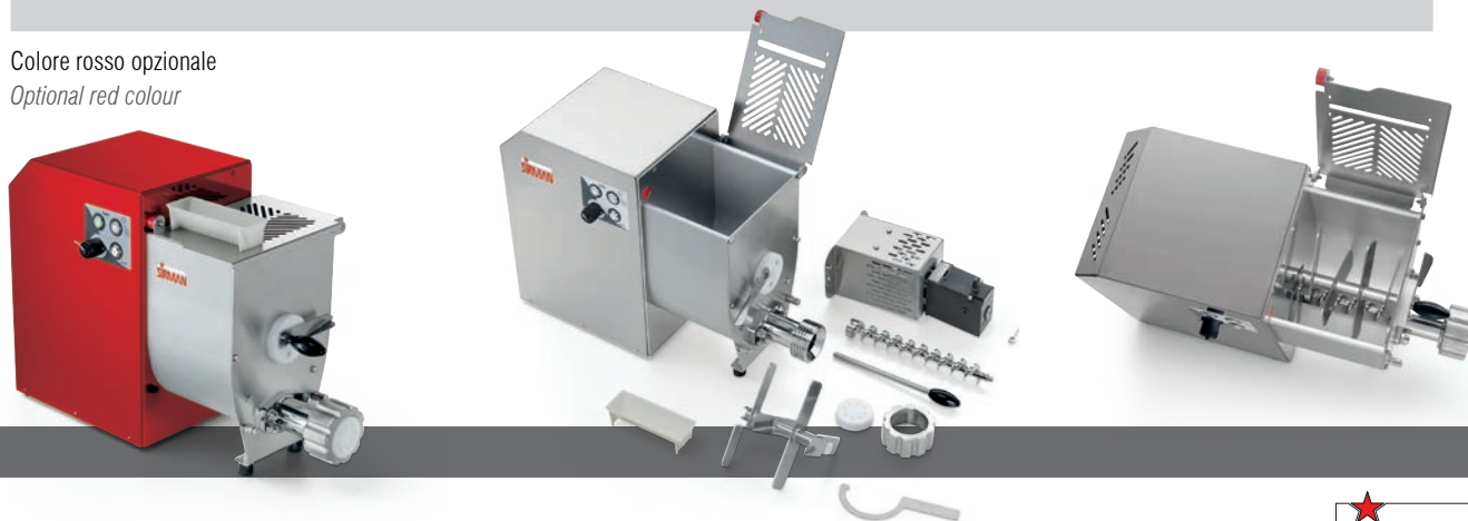
Colore rosso opzionale Optional red colour