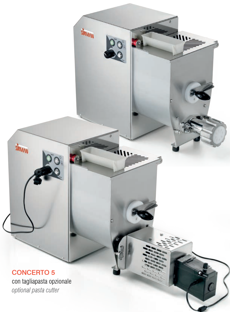
CONCERTO 5 con tagliapasta opzionale optional pasta cutter