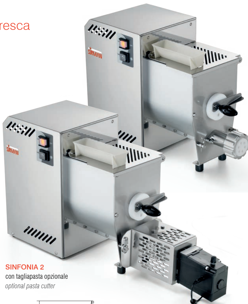
SINFONIA 2 con tagliapasta opzionale optional pasta cutter